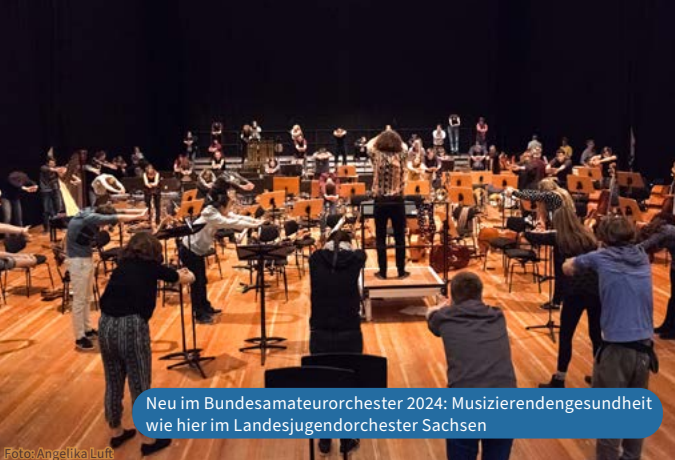
Neu im Bundesamateurorchester 2024: Musizierendengesundheit wie hier im Landesjugendorchester Sachsen